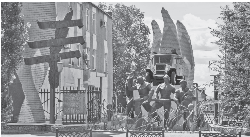
Мемориал пожарным Оренбуржья.