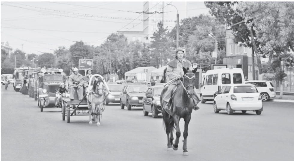
Парад во главе конного пожарного.