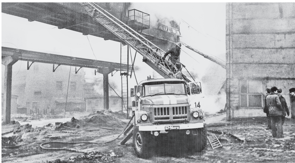
Пожар на Орско-Халиловском комбинате.

Первым к месту пожара прибыл караул ПЧ-17, произвел боевое развертыва-