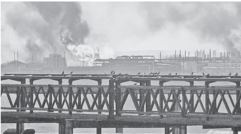
Горит гелиевый завод.

18 ноября 1987 г. на Оренбургском гелиевом заводе произошел взрыв смеси конденсата с газом на технологической колонне, от которого в небо взлетел дымовой гриб, похожий на атомный взрыв. Массивная крышка колонны отлетела почти на полкилометра. Погибло двое рабочих, пытавшихся вручную закрыть крышку. В тушении пожара приняло участие 2 пожарных поезда, проведены 2 пенные атаки. Борьба с пожаром длилась более двух суток. Ликвидация пожара усложнялась реальной угрозой новых взрывов, так как заводские специалисты не могли гарантировать недопущения утечки газа и конденсата из прого-