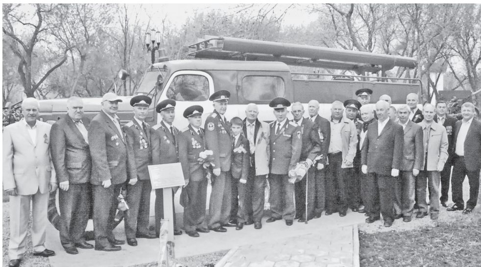
Ветераны у пожарного автомобиля ЗИЛ-157.