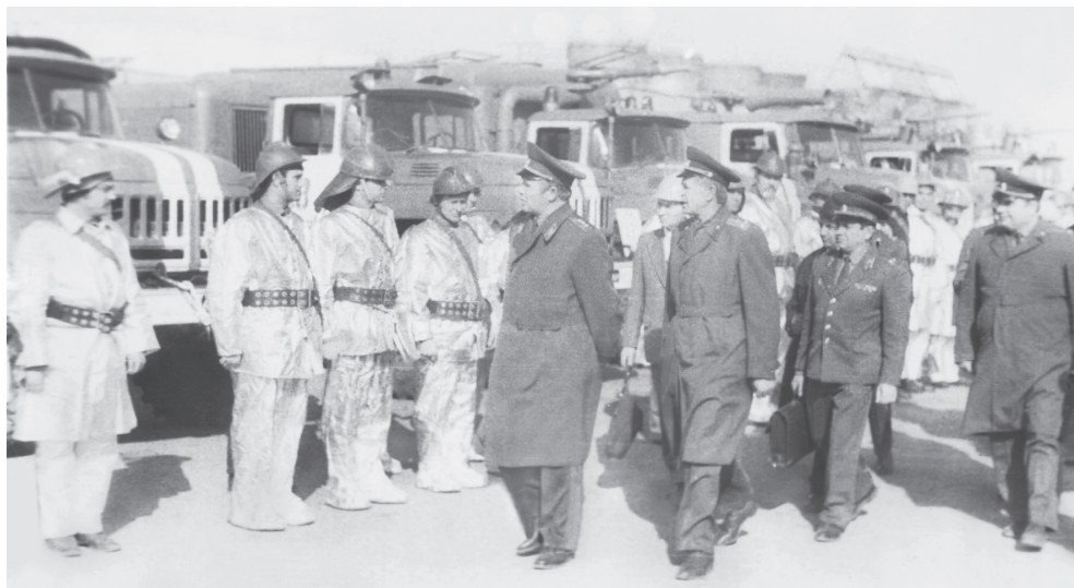
Осмотр личного состава военизированной пожарной части.