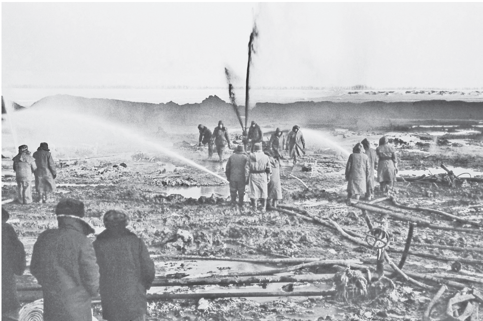
Пожар газового фонтана ликвидирован.

Геологи и пожарная охрана не были готовы к ликвидации и тушению такого мощного фонтана. Не было и опыта, и специальной техники. По решению заинтересованных министров на ликвидацию аварии были направлены специалисты из других регионов страны. Пришла и специальная техника – реактивные установки газо-водяного тушения (АГВТ-100), пожарные насосные станции, автомобили с пожарными рукавами диаметром 150 мм.