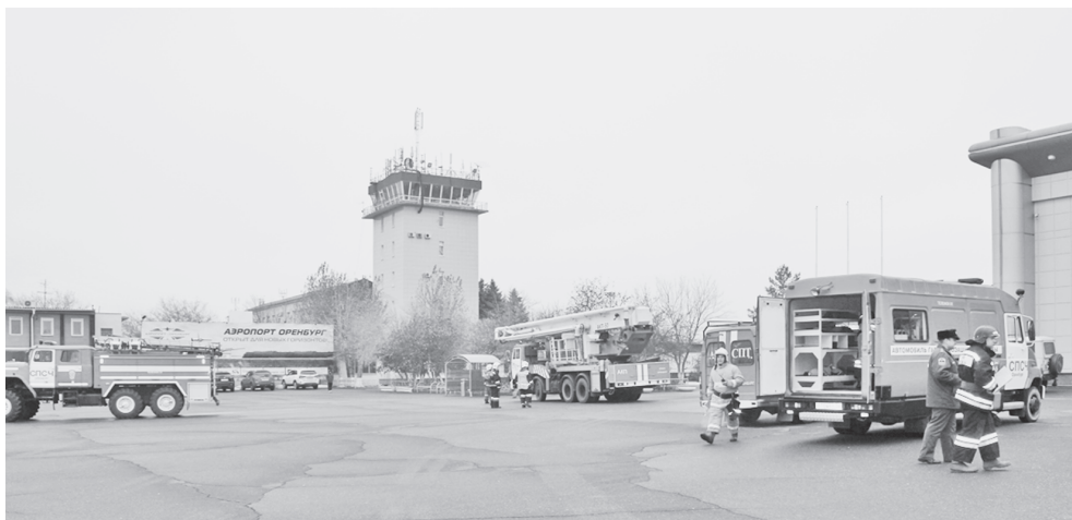
Пожарно-тактические учения на здании аэропорта г. Оренбург.