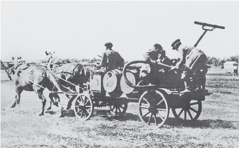
Конный пожарный ход.

Первая мировая война, дестабилизация власти с февраля 1917 г., Октябрьская революция и начавшаяся Гражданская война подкосили и без того низко-профессиональную, технически слабо вооруженную и нищую пожарную охрану России. Пожары становились сушим бедствием для молодой советской республики, да и всего народа. Совет народных комиссаров Российской Советской Федеративной Республики вынужден был принимать радикальные меры для борьбы с пожарами. 17 апреля 1918 г. председатель Совнаркома В.И. Ленин подписал Декрет об организации государственных мер борьбы с огнем.